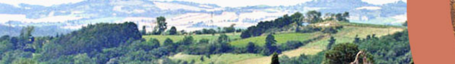
Vue d'ensemble du village d'Odars et les routes qui traversent le village